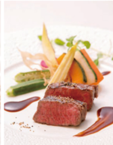
レストランのみの利用も可能。ランチ1,550円～、ディナー 3,150円～。こだわりの創作フレンチを堪能して